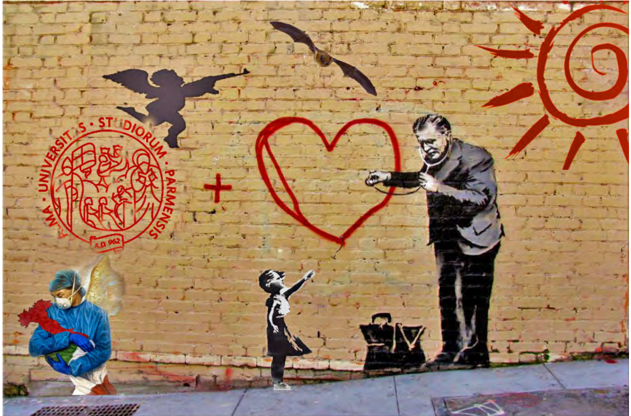
Banksy et al.