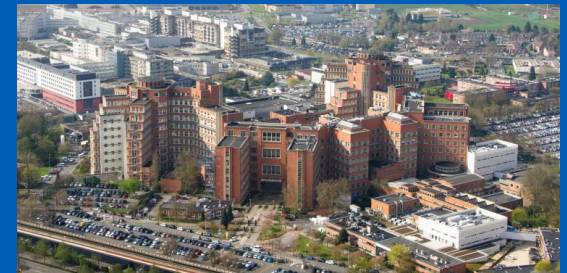
Centre Hospitalier-Universitaire (CHU) de Lille