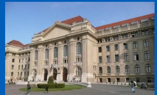
Debrecen University Hospital and Faculty of Medicine