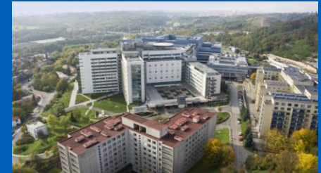
Third Faculty of Medicine, Charles University, Prague