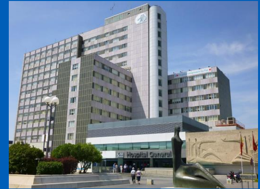
Hospital Universitario La Paz, Madrid