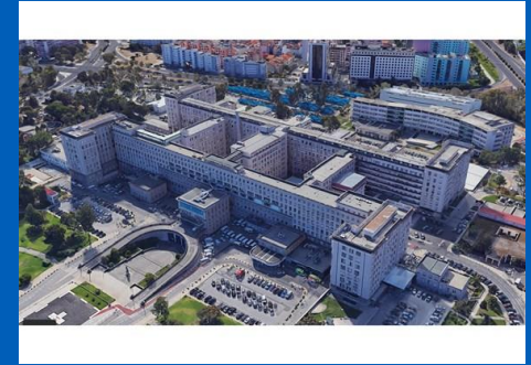
Centro Hospitalar Universitario Lisboa Norte