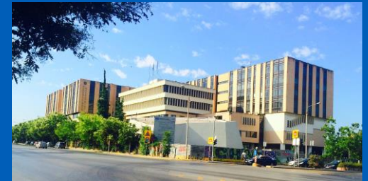
Achepa University Hospital of Thessaloniki